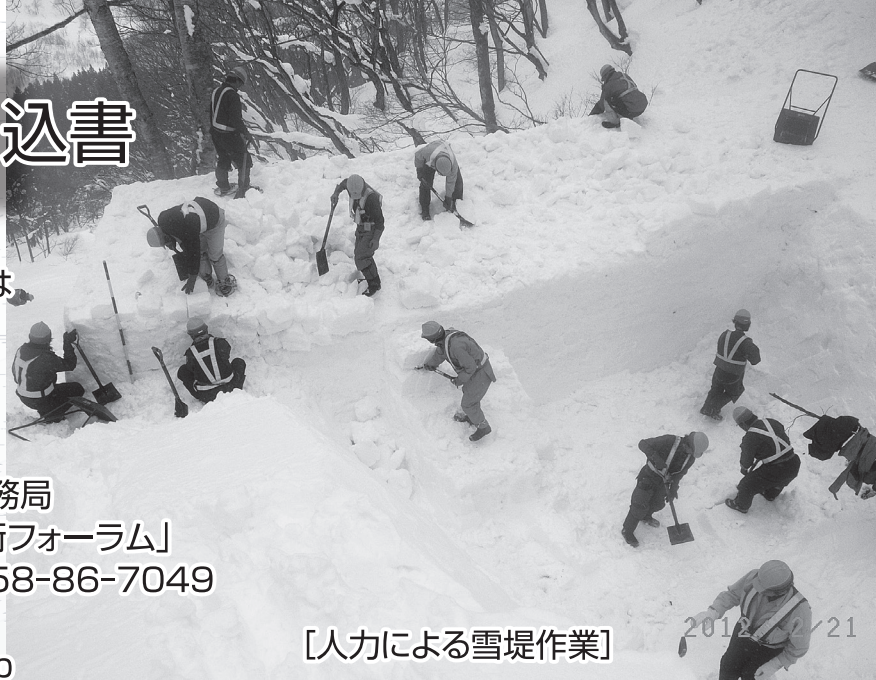
[人力による雪堤作業]